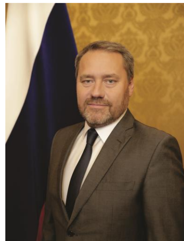
Председатель Законодательного Собрания Санкт-Петербурга Александр Бельский

В этот праздничный день желаю вам здоровья, счастья, радостного настроения и отличных оценок на весь учебный год!