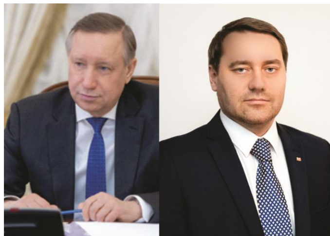
Губернатор Санкт-Петербурга Александр Беглов Председатель Законодательного Собрания Санкт-Петербурга Александр Бельский

Желаю всем жителям города на Неве здоровья, счастья и мирного неба над головой. С праздником! С Днём Великой Победы!