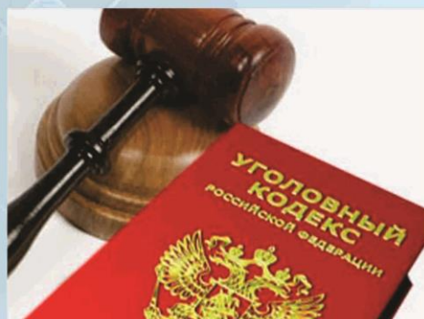
ПАМЯТКА НАСЕЛЕНИЮ 2023