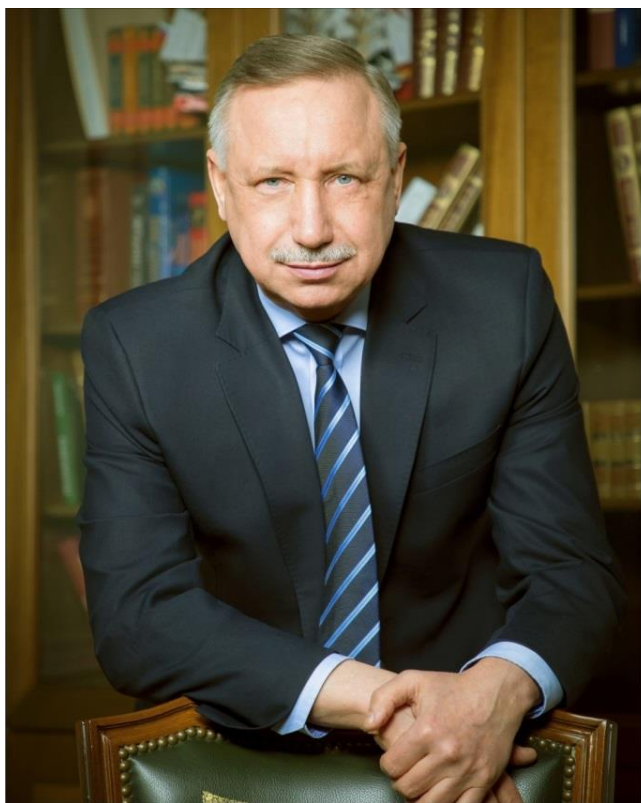
Губернатор Санкт-Петербурга А.Д. Беглов

Слава российскому Военно-Морскому Флоту!