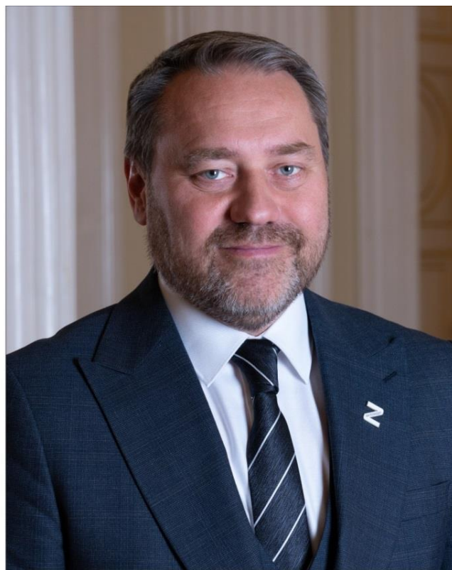
Председатель Законодательного Собрания Санкт-Петербурга А.Н. Бельский