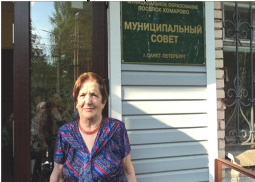
Мария Рольникайте, фото июль 2012 года. Комарово

21 июля 2012 года исполнилось бы 95 лет со дня рождения Марии Григорьевны Рольникайте. Эта обаятельная темноглазая женщина была известна в мире как «вильнюсская Анна Франк», потому что ее детство и юность были искалечены войной. Четырнадцатилетней девочкой она оказалась в еврейском гетто в Вильнюсе, а потом в двух нацистских лагерях Штраденгоф и Штутгофф. В гетто и лагерях она вела дневник и писала стихи. Она прошла лагеря смерти, потеряла там мать, сестру и брата. Она прошла через ад и написала об этом.