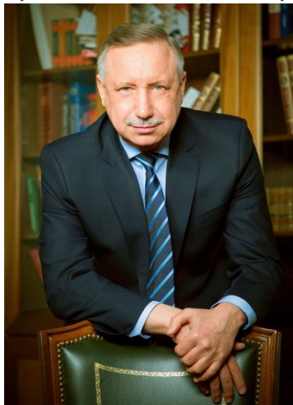
Губернатор Санкт-Петербурга А.Д. Беглов

Мы всегда будем восхищаться искусной работой строителей Санкт-Петербурга, великих зодчих и простых мастеров. Будем свято хранить память о героическом подвиге защитников и жителей блокадного Ленинграда. Наша благодарность - создателям военного, про-