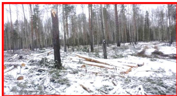
Изображение № 6 Заготовленная древесина на лесосеке. Не является валежником

штабели, являются собственностью арендатора лесного участка, соответственно забрать такую древесину нельзя (смотри изображение № 6, 7).