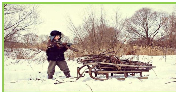
Изображение № 8

местах проведения лесосечных работ, на лесосеках, незаконченных рубкой, в местах складирования древесины.