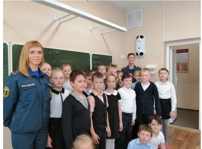
ОНДПР Курортного района УНДПР ГУ МЧС России по СПб СПб МО ВДПО в г. Зеленогорск Территориальный отдел по Курортному району УГЗ ГУ МЧС России по г. Санкт-Петербургу