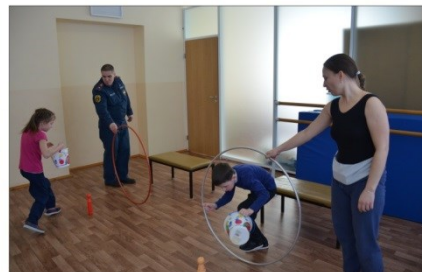
ОНДПР Курортного района УНДПР ГУ МЧС России по СПб ВДПО в г.Зеленогорск ТО МЧС по Курортному району УГЗ ГУ МЧС России по СПб