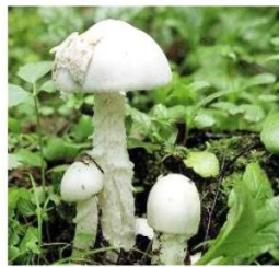
МУХОМОР БЕЛЫЙ ВОНЮЧИЙ