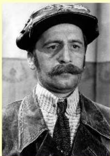
Николай Боярский в роли Адама Козлевича. Фильм «Золотой телёнок».

Николай Александрович Боярский, Народный артист Российской Федерации, родился в 1922 году в городе Колпино. Он снялся более чем в трёх десятках фильмов. Наиболее известные его роли - Адам Козлевич в легендарном фильме Михаила Швейцера “Золотой телёнок” (1968), Советник в “Снежной королеве” (1966), Физрук в “Приключениях Электроника” (1979), Петушков в фильме “Живой труп” (1968). Ленинградские театралы помнят яркие роли Николая Боярского на сцене театра имени В.Ф.Комиссаржевской, где он играл вместе со своим братом, Сергеем Боярским. Ролям в кино и в театре предшествовала непростая биография: арест и расстрел отца, священника православной церкви; война, которую Николай Боярский начал под Ленинградом, был ранен, прошел многие фронты и плен; награжден двумя Орденами Славы и Орденом Красной звезды.