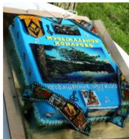
« Blue Canary», « », «Gangnamstyle»,